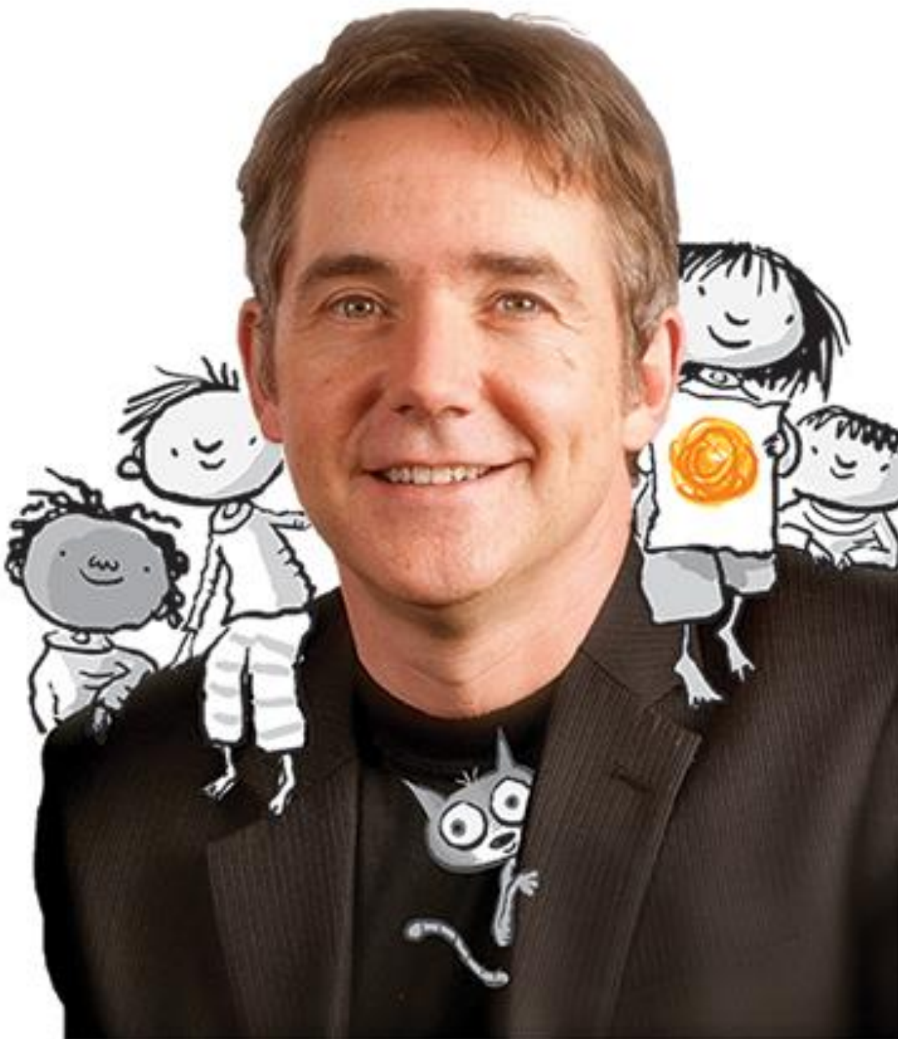
Rysunek 1