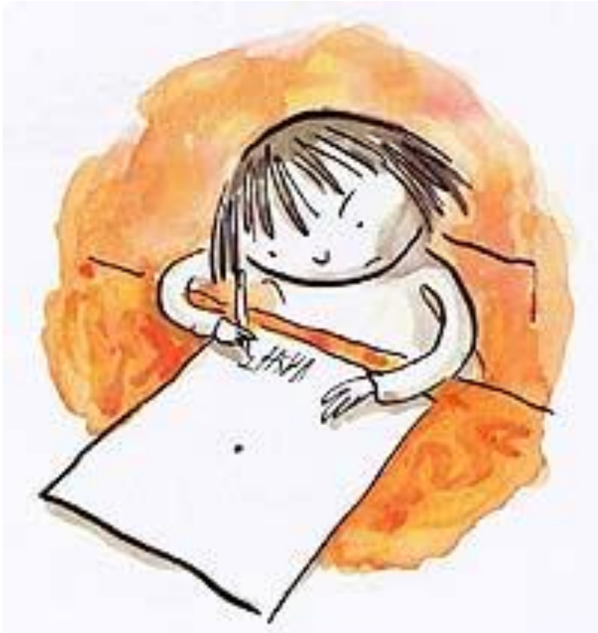
Rysunek 2